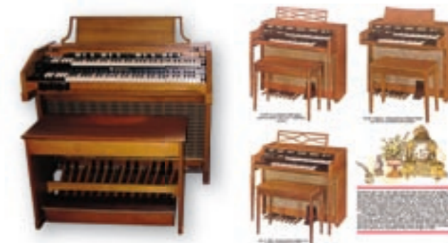
Model A100 1969 en de M100-serie; de inspiratiebronnen voor de M-44

De legendarische Hammond M-100 is de inspiratie bron geweest voor een nieuw Hammond spinet model de M-44. De M-44 is echter veel meer dan een moderne replica van de M-100. Bij de ontwikkeling van dit nieuwe instrument is men uitgegaan van de filosofie dat de M-44 een tijdloos instrument diende te zijn met de allerbeste Hammond sound. De M-44 heeft (96) onafhankelijk werkende digitale toonwielen en reproduceert daardoor feilloos de klank van de Hammond B-3 toonwiel orgels. Bovendien is dit instrument volledig polyfoon. Deze nieuwe Hammond bedient u precies zo als de oude toonwiel orgels zoals, B-3, C-3, A-100 enz. De presets kiest u o.a. via de omgekeerd gekleurde zwart/witte toetsen terwijl u het beroemde vibrato instelt met de ronde Vibrato knop. De klavieren van de M-44 bezitten de zogenoemde "Waterfall keys" zoals op de B-3, C-3, A-100 enz. Uniek is dat dit nieuwe spinet model van Hammond is uitgerust met een buizen voorversterker die zo belangrijk is voor de warme, of naar wens, knauwende "overdrive" klank. De M-44 is uitgevoerd met een DSP effect generator die perfect het beroemde "Scanner-Vibrato" genereert. Ook kunt u via het bedieningsmenu de door u gewenste 2 rotor Leslie simulatie kiezen. Er is zelfs een keuze uit verschillende virtuele Leslie boxen zoals